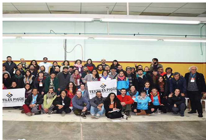
VII Encuentro de economía de las trabajadoras y los trabajadores. Del 30 de agosto al 2 de septiembre de 2017 en el Hotel Bauen y textiles Pigüe, Buenos Aires y Pigüe, Argentina.

Además de ello, este proceso aporta experiencia al conjunto de la clase conjunto de la clase a nivel mundial, abre horizontes de posibilidad frente a