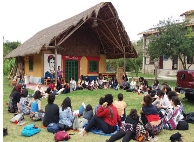
Conversatorio de mujeres en VII Encuentro de economía de las trabajadoras y los trabajadores. Del 25 a 29 de septiembre del 2019 en la Escuela Nacional Florestan Fernandes (ENFF), Guararema, São Paulo, Brasil.